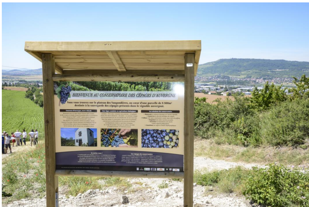
Panneau informatif installé le long d'un chemin de promenade en bord de parcelle.