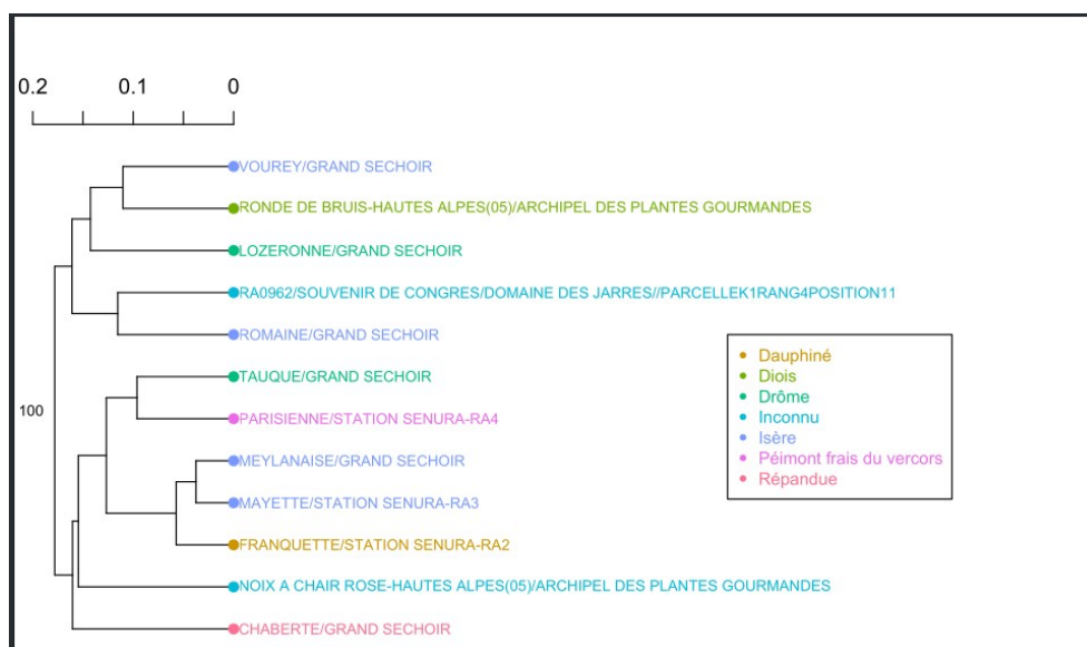
ARBRE PHYLOGENETIQUE PAR REPARTITION GEOGRAPHIQUE

Nous soulignons l'importance de réaliser des analyses génétiques dans ce type de projet de sauvegarde de ressources phylogénétiques et remercions l'accueil du travail du laboratoire BioGeves.