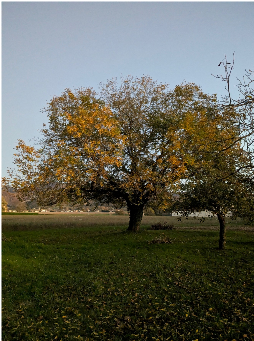
Noyer 'Joaninte', retrouvée à Charpey (Drôme) en octobre 2025

La veille documentaire se poursuivra, pour affiner les fiches variétés pour les fiches incomplètes