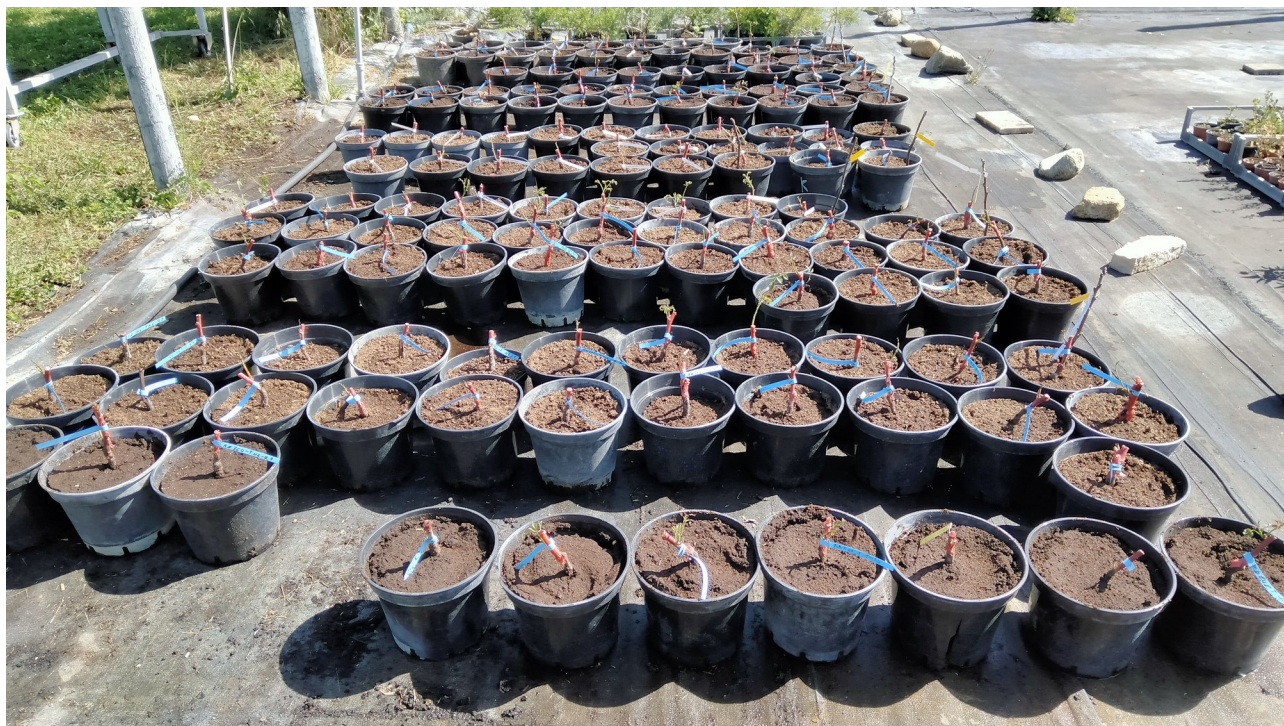
LES ARBRES GREFFES, EMPOTES PAR LES APPRENANTS DU CFPPA TERRE D'HORIZON

Après lui avoir déposé la collecte des greffons des différentes variétés, la pépinière a pu greffer en oméga une petite centaine d'arbres. Son procédé comprend un passage en chambre chaude (greffes conservés dans de la sciure), puis chambre d'acclimation avant d'être sorties à l'air libre. Livrés en mai 2024, pour assurer la reprise, les arbres ont été empotés dans un substrat pour arbustes (dépense supplémentaire réalisée dans le cadre du projet) puis installés en extérieur sur une plateforme avec irrigation programmée.