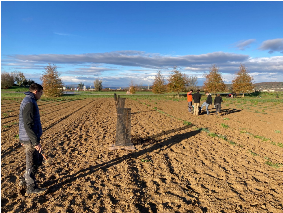
CHANTIER DE PLANTATION DU VERGER CONSERVATOIRE