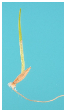
Fig. 1. Plantule normale de Chiendent pied de poule

Pour chaque répétition indiquer : le nombre de plantules normales, de plantules anormales, de semences fraîches et de semences mortes.