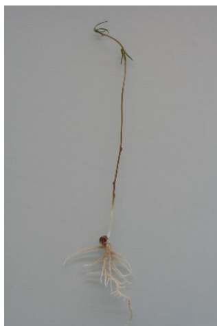
Fig. 1. Plantule normale de Vesce

Pour chaque répétition indiquer : le nombre de plantules normales, de plantules anormales, de semences dures, de semences fraîches et de semences mortes.