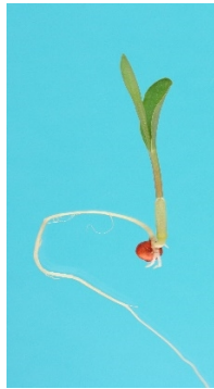
Fig. 1. Plantule normale de Sorgho

Pour chaque répétition indiquer : le nombre de plantules normales, de plantules anormales, de semences fraîches et de semences mortes.