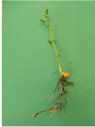
Fig. 1. Plantule normale de pois chiche

Pour chaque répétition indiquer : le nombre de plantules normales, de plantules anormales, de semences dures, de semences fraîches et de semences mortes.