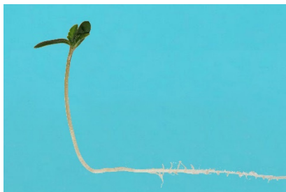
Fig. 1. Plantule normale de Chanvre

Pour chaque répétition indiquer : le nombre de plantules normales, de plantules anormales, de semences fraîches et de semences mortes.