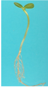
Fig. 1. Plantule normale de Tournesol

Pour chaque répétition indiquer : le nombre de plantules normales, de plantules anormales, de semences fraîches et de semences mortes.