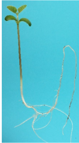
Fig. 1. Plantule normale de soja

Pour chaque répétition indiquer : le nombre de plantules normales, de plantules anormales, de semences dures, de semences fraîches et de semences mortes.