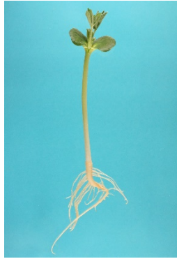
Fig. 1. Plantule normale de Lupin

Pour chaque répétition indiquer : le nombre de plantules normales, de plantules anormales, de semences dures, de semences fraîches et de semences mortes.