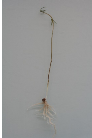
Fig. 1. Plantule normale de Vesce Commune

Pour chaque répétition indiquer : le nombre de plantules normales, de plantules anormales, de semences dures, de semences fraîches et de semences mortes.