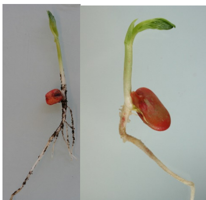
Fig. 1. Plantule normale de fêverole (à gauche) et fève (à droite)

Pour chaque répétition indiquer : le nombre de plantules normales, de plantules anormales, de semences dures, de semences fraîches et de semences mortes.