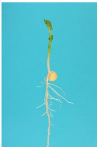
Fig. 1. Plantule normale de pois

Pour chaque répétition indiquer : le nombre de plantules normales, de plantules anormales, de semences dures, de semences fraîches et de semences mortes.