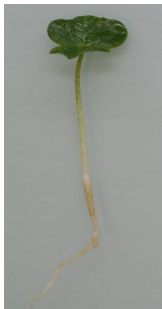
Fig. 1. Plantule normale de Coton